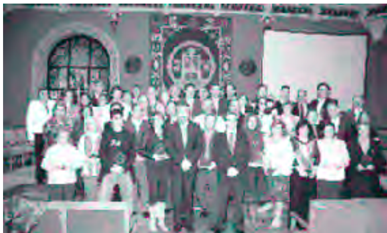
Foto de familia de los candidatos a la cuarta edición del Premio EBRÓPOLIS

La Oficina Verde es uno más de los numerosos proyectos de la asociación Manuel Viola. Lleva una década de activa sensibilización medioambiental en el barrio de Delicias y, entre sus iniciativas, destaca la premiada oficina para la recogida de denuncias medioambientales.