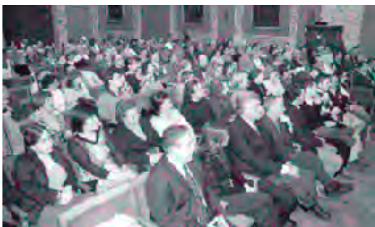
Dos centenares de personas asistieron al acto de entrega

En las anteriores ediciones, han sido galardonadas la Asociación de Mujeres Aragonesas de Cáncer Genital y de Mama (AMAC-GEMA), la Escuela de Español promovida por un grupo de profesores voluntarios coordinados por la Comisión de Defensa de Inmigrantes en Aragón (CODIA) y la empresa de inserción laboral Consolida Oliver.