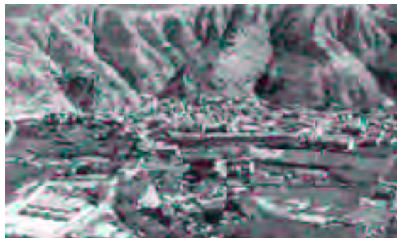
El número de alumnos de Cadrete ha crecido más del 221% en siete años