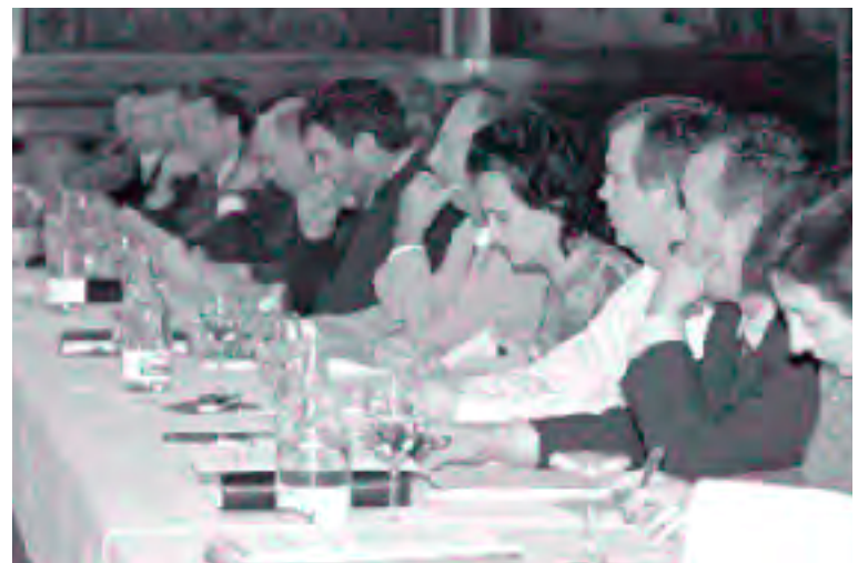
Los alcaldes del entorno comparten la búsqueda de soluciones conjuntas a problemas comunes

Asimismo, en la sesión de trabajo se llegó también al acuerdo de dotar de un carácter permanente a este foro de alcaldes para que, a través de reuniones periódicas y sin pretender suplantar a las administraciones competentes, se trabaje conjuntamente en el impulso y seguimiento de las propuestas de actuación del nuevo Plan.