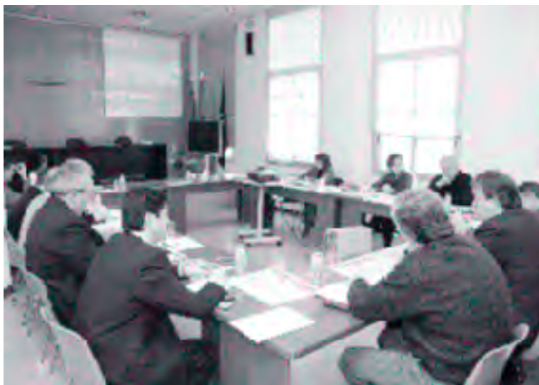
La Comisión de Enlace estudió en enero el documento con las nuevas estrategias de futuro

de las que se desprenden numerosas y variadas propuestas, llamadas a sustituir a las aprobadas por unanimidad en 1998 y que ya han sido ejecutadas o han sido superadas por las circunstancias y a contrarrestar fenómenos de reciente aparición, tal y como la inmigración masiva, el fuerte ascenso del coste de las viviendas, el boom de las nuevas tecnologías o el rápido desarrollo del entorno metropolitano.