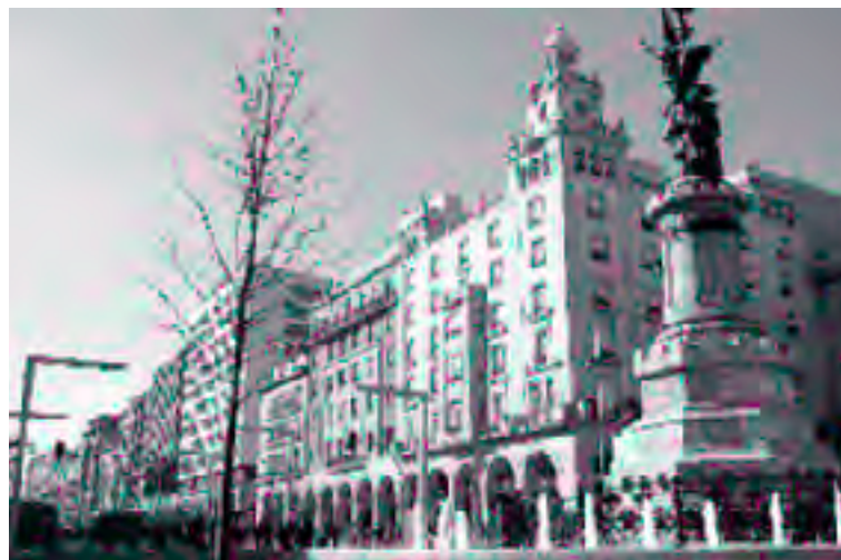
Zaragoza quiere ganar "visibilidad" en el exterior

Los expertos han fijado ocho grandes líneas de actuación,