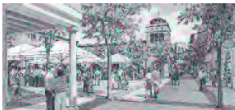
Puerto Venecia quiere abrir sus puertas el próximo diciembre con Ikea

También está ya en obras Aragonia, proyecto de Zaragoza Urbana diseñado por el prestigioso arquitecto Rafael Moneo que transformará notablemente el entorno de la Romareda. Con un diseño vanguardista e innovador, este gran complejo ocupará una superficie construida de 170.000 metros cuadrados que será de usos mixtos.