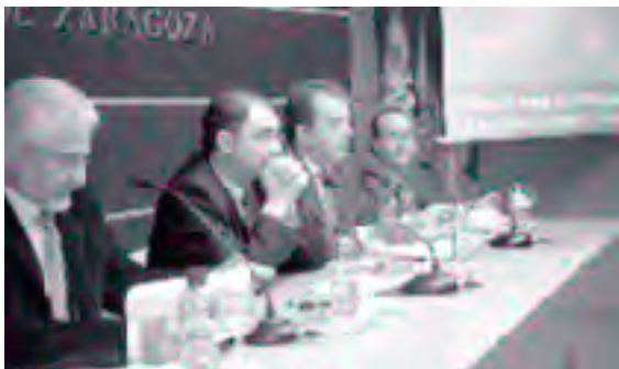
Responsables de EBRÓPOLIS y la DPZ explican a los medios de comunicación el contenido del estudio

Los municipios con mayor incremento poblacional (más del 100%) son los más cercanos a Zaragoza: María de Huerva, La Muela, Pastriz y La