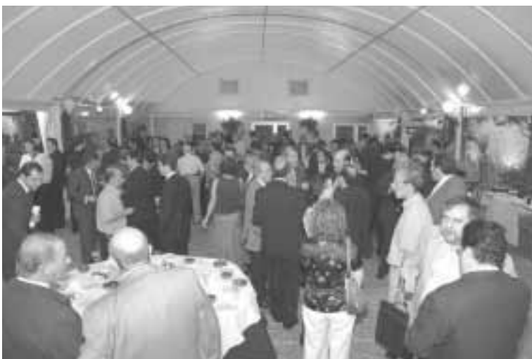
La cena estuvo precedida de un animado aperitivo

El alcalde destacó la utilidad del trabajo desarrollado por la Asociación a lo largo de sus diez años de vida –“todos hemos aprendido de EBRÓPOLIS”, afirmó– y explicó que la revisión y actualización pretende, precisamente, que el Plan Estratégico continúe siendo un “producto operativo” para la ciudad de Zaragoza y los municipios de su entorno.