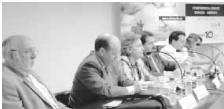
Imagen de los expertos participantes en la jornada de debate

La propuesta del director de la Institución “Fernando El Católico” partiría de la creación de un centro de acogida turística cercano al AVE, un reclamo, en forma de una gran Torre Nueva, que sirva de recibimiento, de mirador sobre el Ebro y de centro monográfico. Este proyecto incluiría una iniciativa ambiciosa, en la que deberían estar implicadas las administraciones, consistente en la creación de una hospedería mudéjar en el convento de Santo Sepulcro.