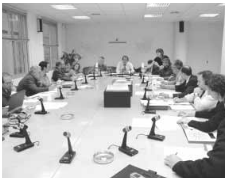
La comisión de enlace unificará criterios

Por su parte, la Universidad de Zaragoza, a través del