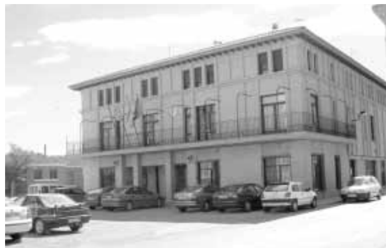
Ayto. de Villanueva

En el plano cultural, Villanueva puede presumir de su torre mudéjar, en cuya rehabilitación ya están trabajando. Asimismo, desde el Consistorio se muestran muy orgullosos de uno de sus hijos más ilustres, el pintor Pradilla, a quien recuerdan con un concurso anual de pintura.