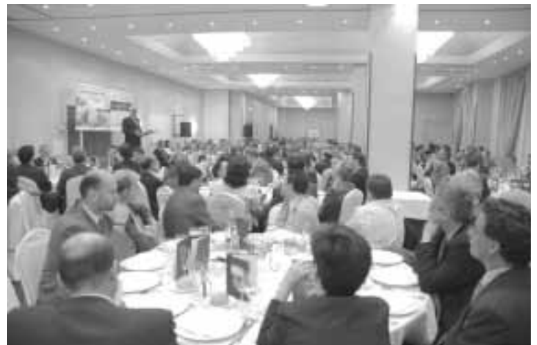
Más de doscientas personas acudieron a la cita

El presidente de Caja Inmaculada fue claro en sus mensajes: Zaragoza disfruta de numerosas oportunidades y ventajas, pero