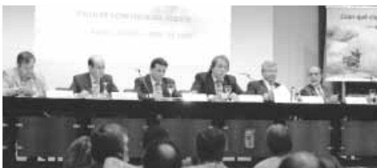
Los expertos coinciden en la urgencia de adoptar decisiones

En cualquier caso, pese a los distintos planteamientos expuestos a lo largo del debate, la conclusión fue clara. Zaragoza y su entorno necesitan soluciones urgentes en materia de transportes e infraestructuras. Tienen ante sí numerosas oportunidades y poco tiempo para materializarlas por lo que no pueden perderse en un debate eterno. Es la hora de actuar.