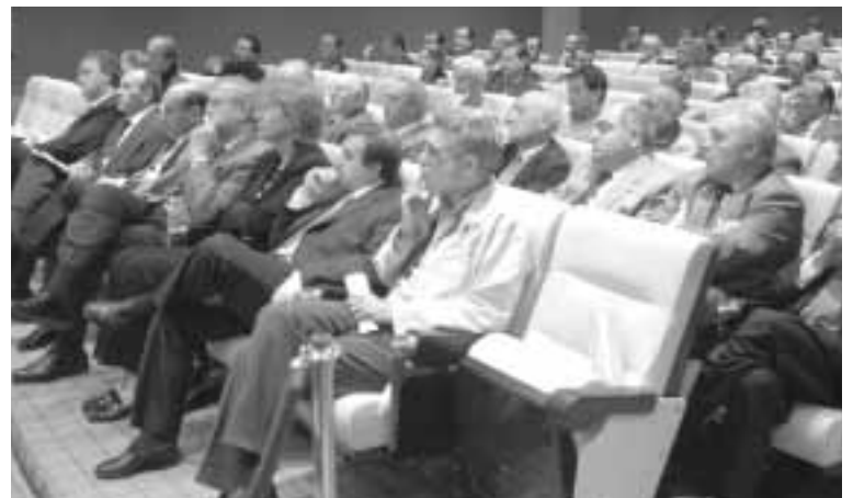
Los alcaldes del entorno no faltaron a la cita