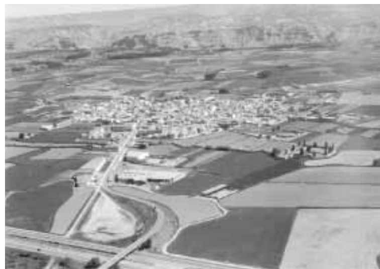
Torres de Berrellén disfruta de la cercanía de dos ríos

Torres de Berrellén es la cuna natal de varios aragoneses ilustres, entre los que se encuentra Juan Pablo Bonet. Todos los años la Asociación de Sordomudos de Zaragoza peregrina a la localidad para rendir homenaje a la memoria del hombre que supo abrir cauces nuevos para romper la incomunicación del mundo del silencio.