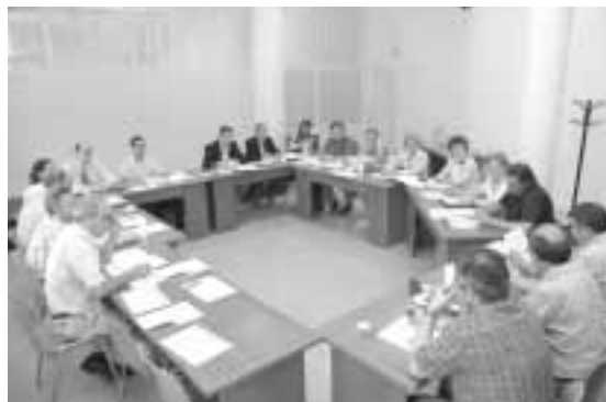
La CIEP 1 destaca los importantes avances en materia logística

Del apartado cultural se puede destacar el incremento de la oferta museística en los últimos años con la apertura, entre otros, del Centro de Historia de Zaragoza, el Museo del Teatro Romano, el puerto fluvial, etc.