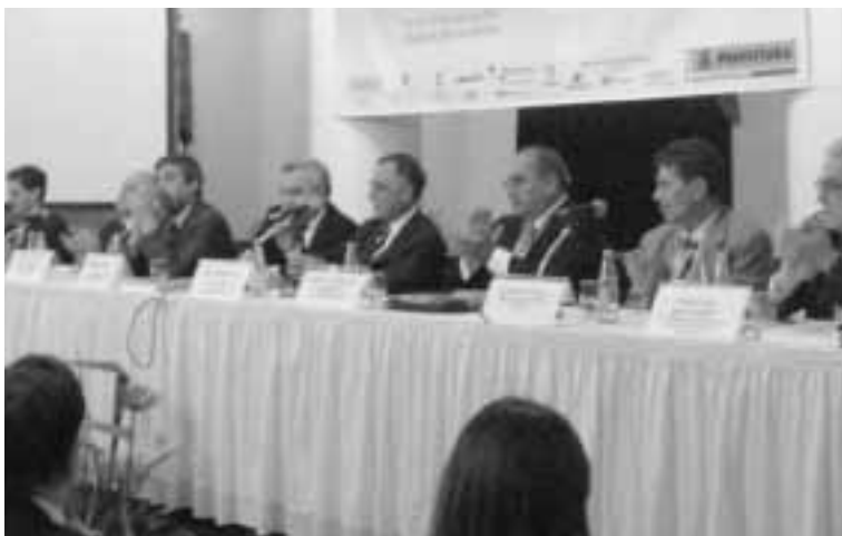
Ayuntamiento de Zaragoza

La importancia de la presidencia zaragozana del CIDEU se incrementa notablemente al coincidir en su primer año con la designación de la ciudad que acogerá la Exposición Internacional de 2008. Precisamente, la Asamblea General aprobó una declaración específica de apoyo a la candidatura de Zaragoza.