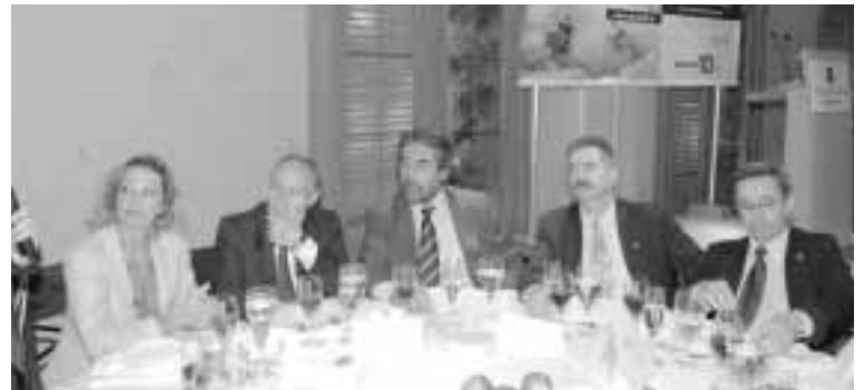
Imagen de parte de la mesa presidencial

Tras la exposición del presidente de Endesa, diversas autoridades presentes en la cena quisieron aportar su granito de arena a la construcción de un futuro en común y mostraron su total disposición a apoyar el proyecto encarnado por EBRÓPOLIS y