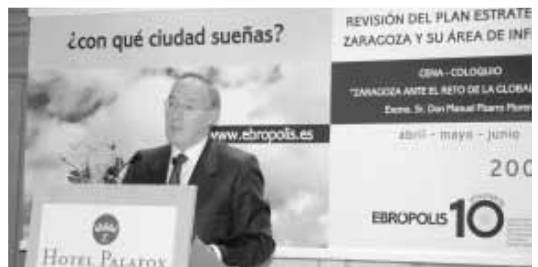
Pizarro se mostró optimista respecto al futuro de Zaragoza

El alcalde y presidente de EBRÓPOLIS quiso cerrar el acto con una alabanza al papel desarrollado por la Asociación durante sus