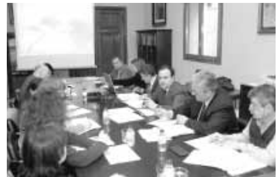
La Comisión 2 está presidida ahora por la Feria de Zaragoza