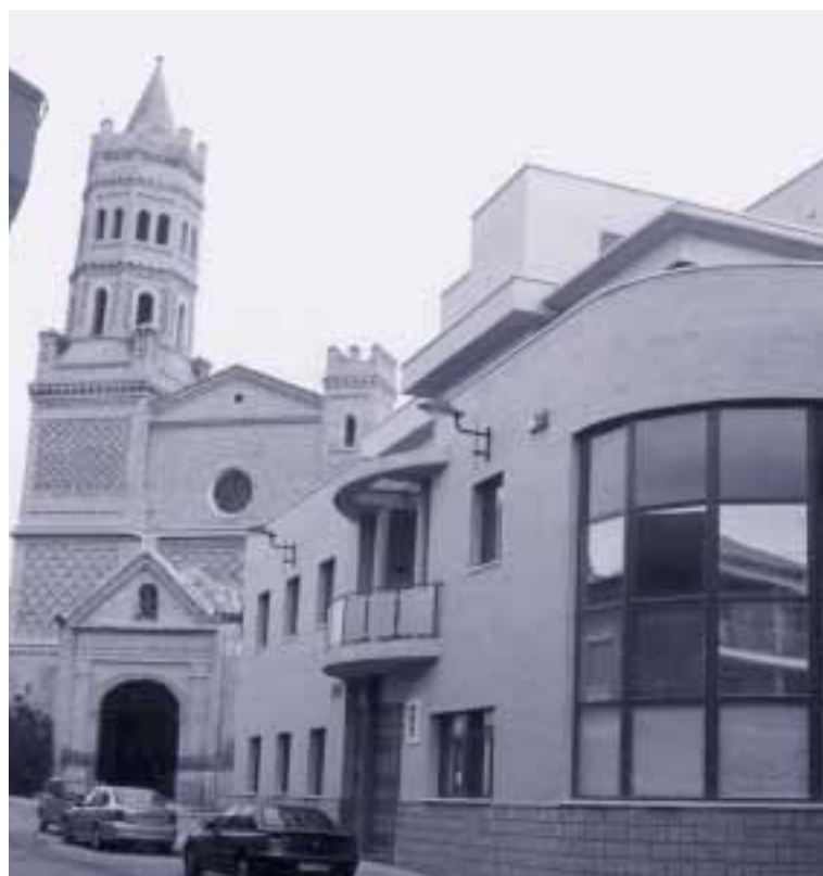
Vista del Ayuntamiento alfajarinense

Todos ellos son sin duda las señas de identidad de un pueblo que quiere ser protagonista de su futuro, mirándolo con optimismo y serenidad.