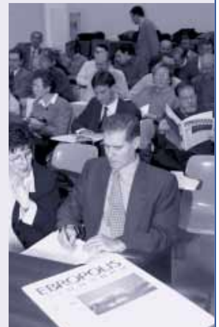
La Mesa ha planteado la creación de un foro permanente de la huerta