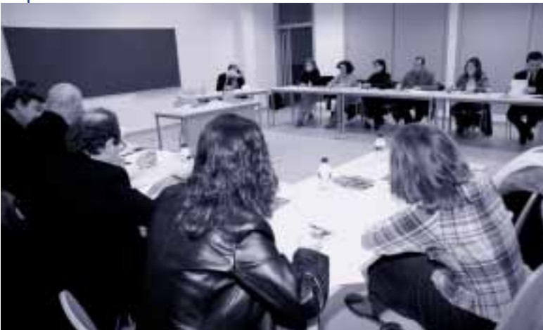
La CIEP 2 visita al Centro de Formación Arsenio Jimeno de UGT

Por otra parte, la Comisión también tuvo acceso a la proposición de acciones operativas para 2002, que se estudiarán para ser aprobadas en una próxima reunión.