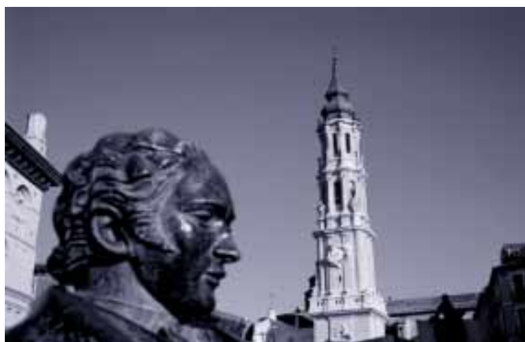
Zaragoza debe potenciar su rico y variado patrimonio cultural

La CIEP 2 –presidida por la Cámara de Comercio– prosigue su labor para potenciar el atractivo de Zaragoza como entorno empresarial idóneo, con criterios de innovación, calidad total y de sostenibilidad medioambiental . Aunque todavía no ha decidido sus acciones operativas para este año, sí conocemos la situación en que se encuentran las del ejercicio pasado.