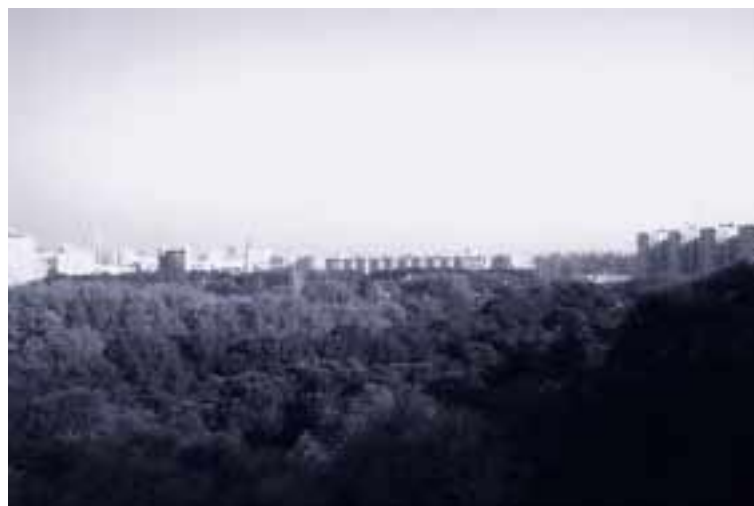
La Agenda 21 pretende impulsar la implantación de los Sistemas de Gestión Medio Ambiental

Si estas son las acciones operativas para el 2002, no debemos olvidar las que lo fueron del pasado año: terminación del