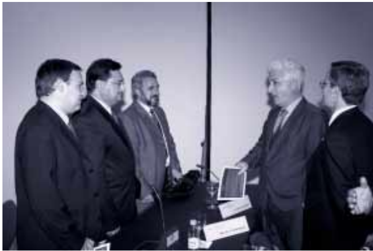
El Justicia y el Rector, entre los asistentes

de la adjudicación que en tal sentido realizará el Consorcio en próximas fechas.