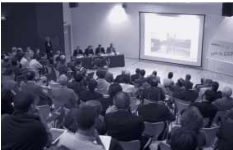
Los socios quisieron conocer de primera mano los detalles del proyecto

Este proyecto, o pliego de condiciones, deberá dar respuesta a las 12 preguntas que formula el Buró Internacional para conceder las exposiciones. Será redactado por la empresa que resulte ganadora