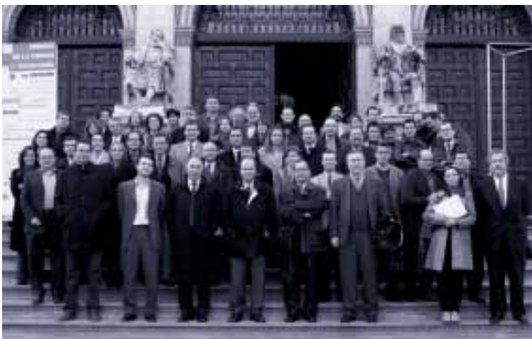
Cada día son más las localidades que se lanzan a la aventura de la planificación estratégica

Asimismo, y entre otras cuestiones, se apuesta por caminar hacia un “urbanismo integral”, en el que el medio ambiente sea una condición previa, y por trabajar, en la senda hacia el desarrollo sostenible, en la persecución del complejo equilibrio entre los intereses económicos, ambientales y sociales.