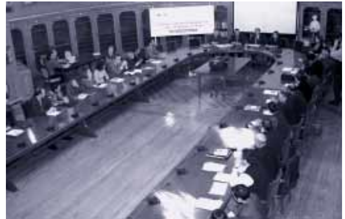
El Paraninfo de la Universidad acogió a los participantes en el Encuentro

Más de 60 responsables de planes estratégicos y expertos en la materia de toda España se dieron cita en Zaragoza el pasado mes de noviembre, en el transcurso del VI Encuentro Ibérico de Directores de Planes Estratégicos Urbanos y Territoriales , organizado como es tradicional por EBRÓPOLIS.