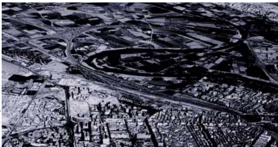
Consortio Pro Expo Zaragoza 2008