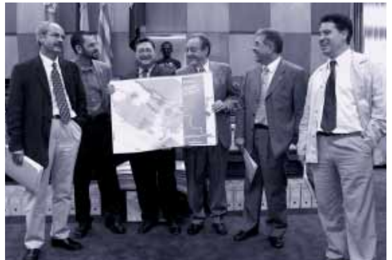
El alcalde y los portavoces de los grupos celebran el consenso

De cara a lograr este ambicioso propósito, el nuevo