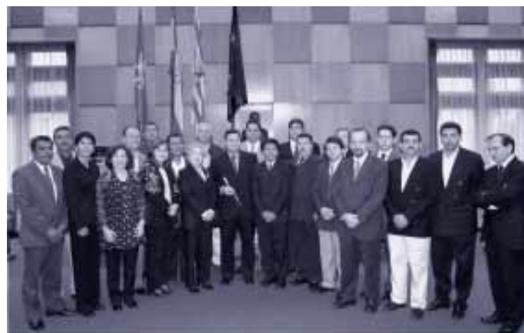
Apertura del IV Curso. Los participantes junto al alcalde de Zaragoza, José Atarés