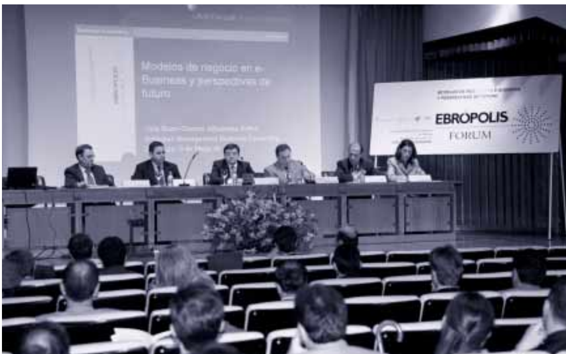
El EBRÓPOLIS Fórum congregó a más de cien personas en el Centro de Exposiciones y Congresos de Ibercaja