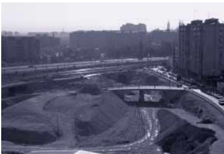
Las obras de la estación intermodal marchan a buen ritmo

Existen otros proyectos de gran trascendencia para todos los zaragozanos, para su calidad de vida y también para sus perspectivas de desarrollo económico, que lógicamente están plenamente recogidos en el PGOU. Así ocurre con la futura plataforma logística, la deseada expo-