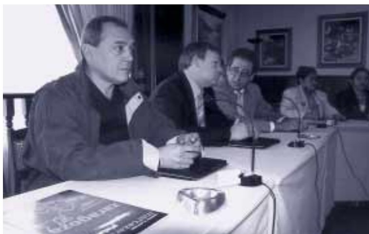
Alcaldes de ASALBO firmaron un convenio de colaboración con Mercazaragoza

El segundo de los cursos que se han organizado este año, dirigido particularmente a dirigentes de Venezuela, aunque también contó con la participación de personas procedentes de otros países, se clausuró el 25 de mayo después de tres semanas de estancia en la capital aragonesa. Como en la edición anterior, 21 directivos municipales, esta vez proce-