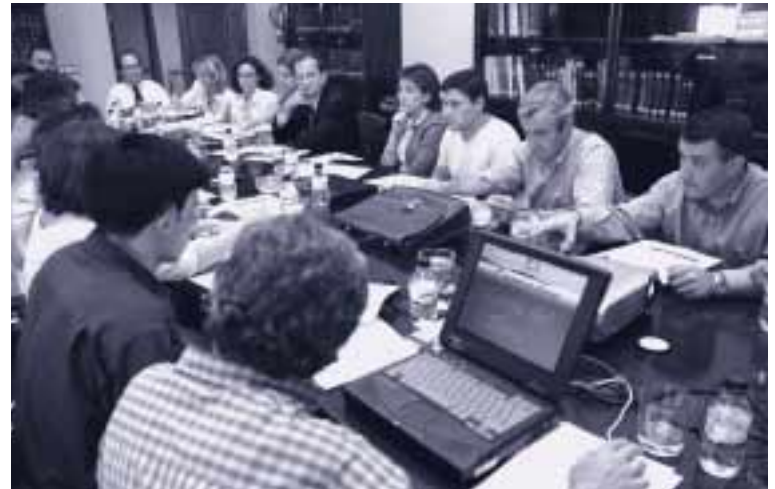
La CIEP 2 recibió a los impulsores del Corredor Verde del Ebro

La proyección exterior de Zaragoza y su entorno, acción prioritaria de esta CIEP para este año, fue otro de los asuntos abordados. Los responsables de las tres administraciones con competencias en materia de turismo y promoción exterior (DGA, DPZ y Ayuntamiento de Zaragoza) expusieron en la sede de EBRÓPOLIS los problemas de infraestructuras con los que se