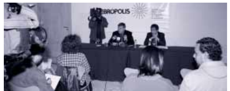
Presentación del Ebrobarómetro a los medios de comunicación

Los más jóvenes y los mayores son los más positivos en este asunto, con el 53'9% y el 51'9% de personas de estos grupos que consideran bueno o muy bueno el nivel de proyección exterior de Zaragoza y su entorno.