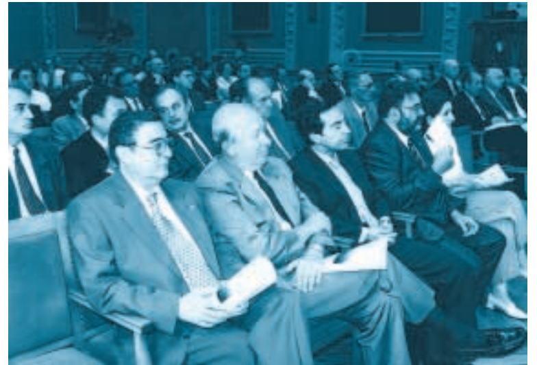
Autoridades, socios y expertos no faltaron a la cita del Paraninfo