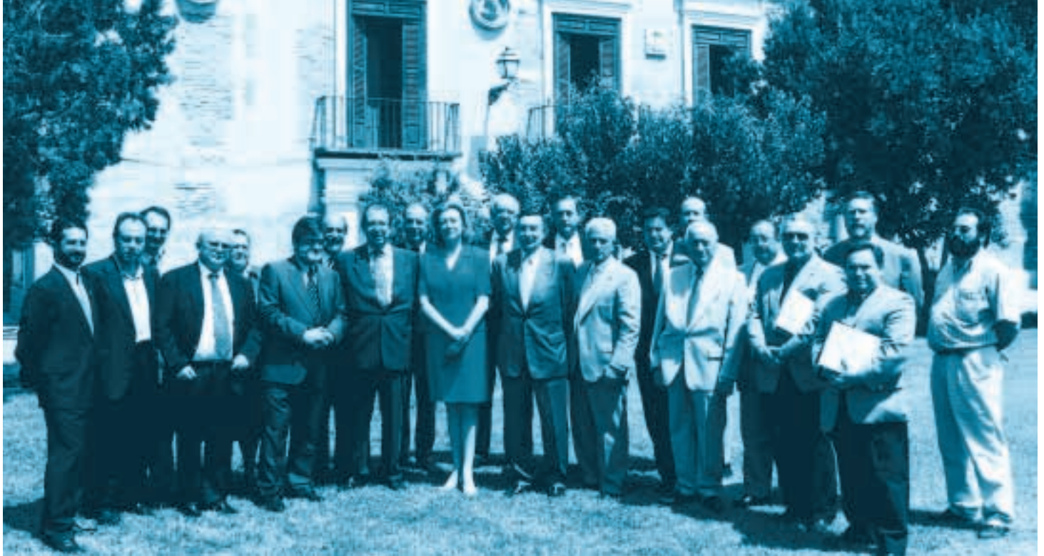
La Torre Santa Engracia acogió el último encuentro de líderes .

« A postamos decididamente y acordamos dedicar los esfuerzos necesarios para implantar el Plan Estratégico de Zaragoza y su Área de Influencia, así como su control, seguimiento, revisión y su actualización». Con esta declaración, los máximos responsables de las trece entidades e instituciones fundadoras de EBRÓPOLIS se han comprometido ante la sociedad zaragozana a llevar adelante el contenido del Plan Estratégico y sacar todo el rendimiento posible al trabajo de cuatro años dedicados a pensar Zaragoza , precisamente una reivindicación habitual en boca de todas las personas comprometidas con el futuro de la ciudad y el entorno.